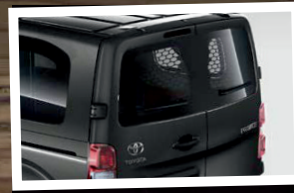
Heckflügeltür mit beheizbarer Heckscheibe

Mit dem PROACE Meistermodell profitieren Sie von zusätzlichen Ausstattungshighlights, die Ihren Alltag noch komfortabler machen.